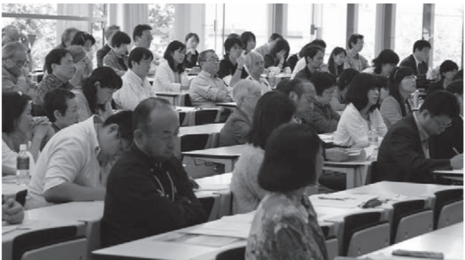
村長のお話に関き入っています。

だから今こそ、「バランス」感覚を磨き、「いのちを大切に暮らす」を目指して、人々のつながりを取り戻す村づくりをやっていかなくてはならないと話された。